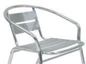
Poltroncina alluminio KELLY