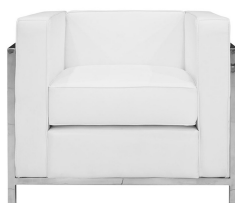
Poltrona bianca in ecopelle (l. 76 cm - h. 68 cm - p. 70 cm)