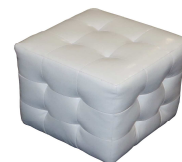
Cubo trapuntato in ecopelle