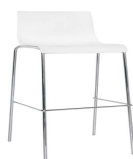
Sgabello con struttura in acciaio cromato,