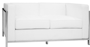
Divano bianco in ecopelle 2 posti (l. 130 cm - h. 68 cm - p. 70 cm)